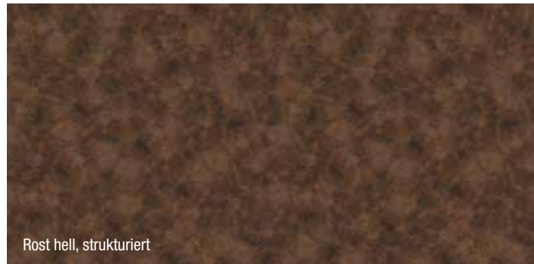
Rost hell, strukturiert