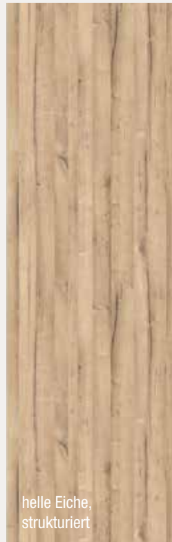
helle Eiche, strukturiert