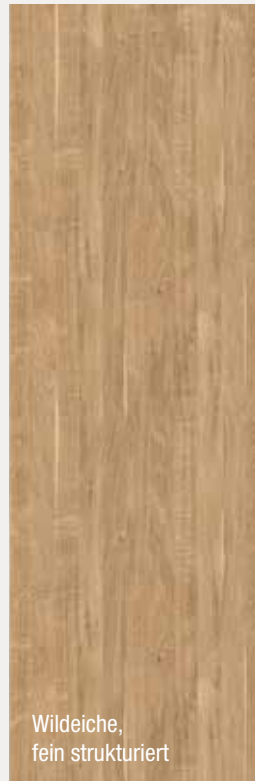
Wildeiche, fein strukturiert