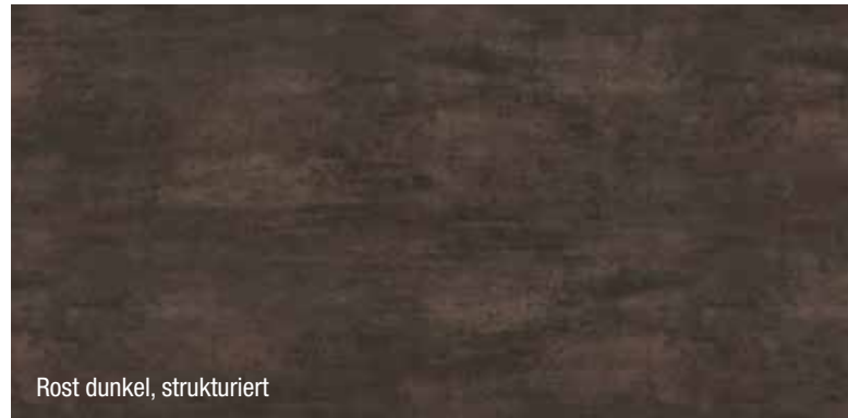
Rost dunkel, strukturiert