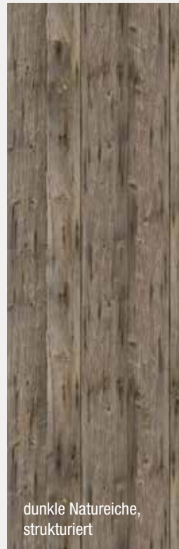
dunkle Natureiche, strukturiert