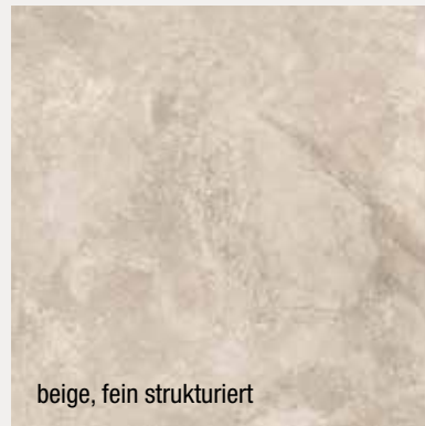
beige, fein strukturiert